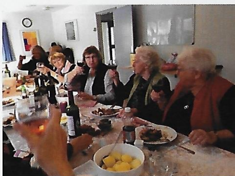
Alle havde selv medbragt drikkevarer.