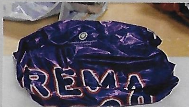
Plastposer hører til i restaffald og ikke i plastcontainerne.

Er du i tvivl hvor det forskellige affald skal hen, så læs på skiltene ved containergården.