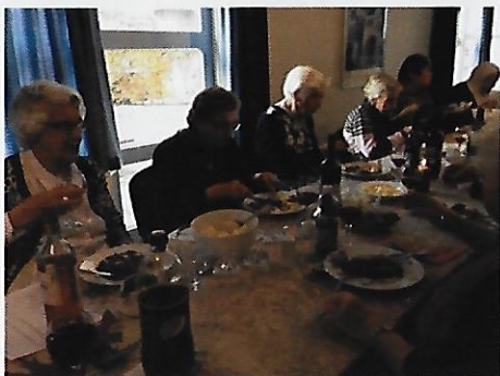
Alle hyggede sig og lidt sang blev det også til imellem.